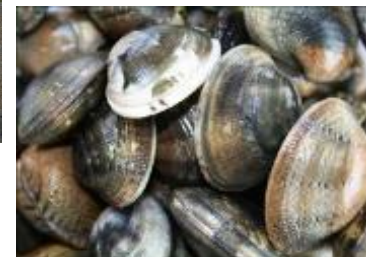
水産生物のブランド化