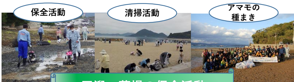
干潟・藻場の保全活動

算定方法の詳細：ブルーカーボンクレジットを活用した持続的な藻場・干潟の保全・再生活動の実践と課題－尾道市沿岸域における取り組みからの考察－，第36回 沿岸域学会講演討論会要旨集，2024.